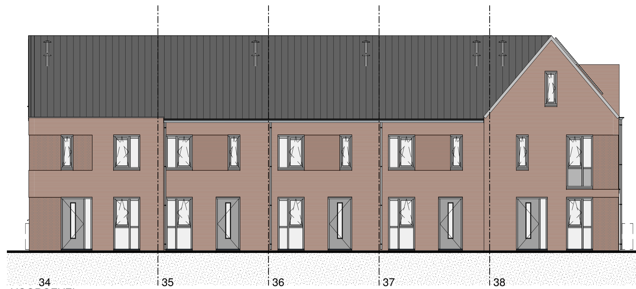
34 VOORGEVEL 1:100