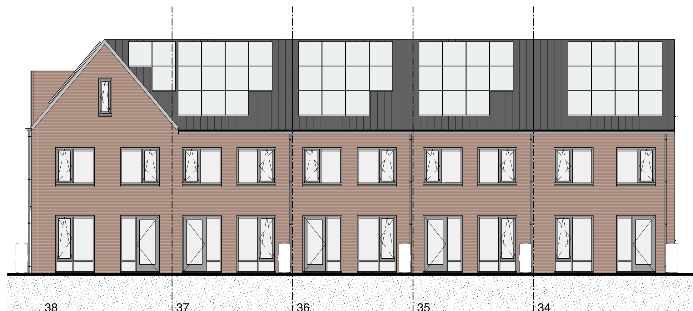
38 ACHTERGEVEL 1:100