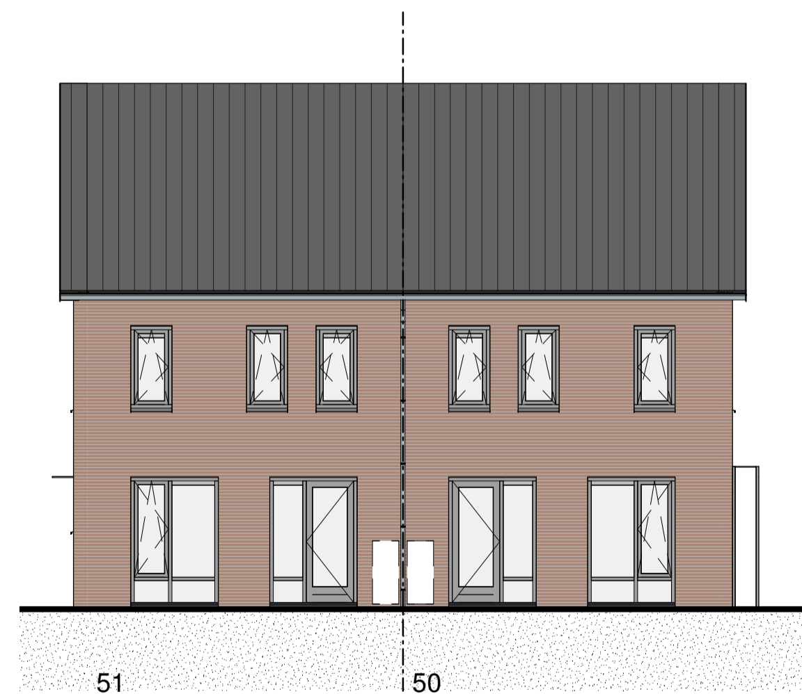
51 ACHTERGEVEL 1:100