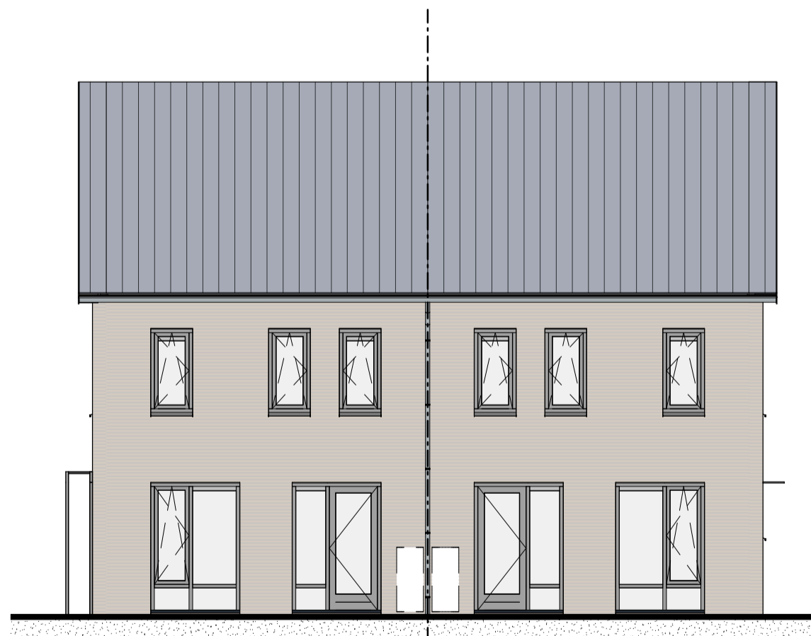
53 ACHTERGEVEL 1:100